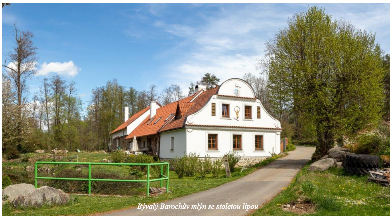
Bývalý Barochův mlýn se stoletou lípou