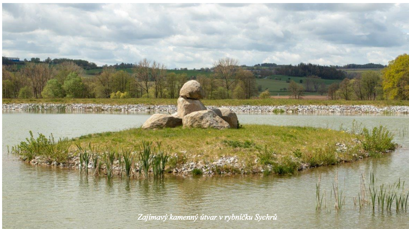
Zajímavý kamenný útvar v rybníčku Sychrů

Ocitáme se uprostřed vsi Zámlyní u kaple s křížem a rozcestníkem. Dříve,