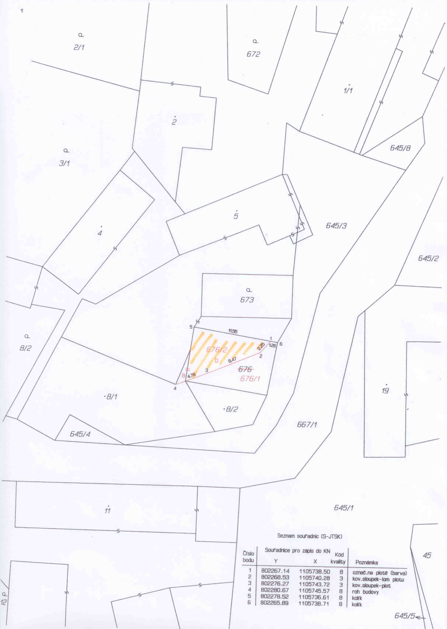
Seznam souřadnic (S-JTSK)