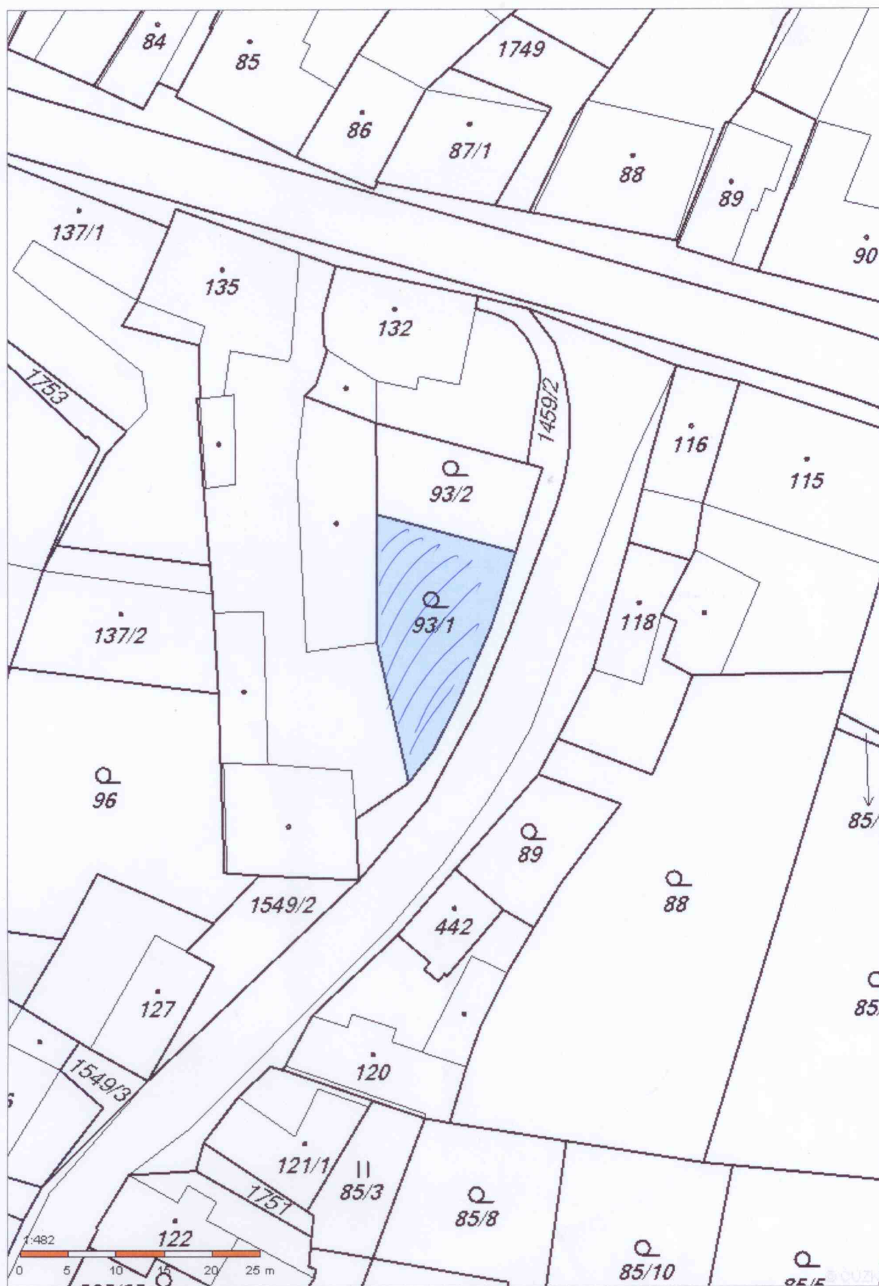
p.č. 93/1 o výměře 238 m 2 v k.ú. Kasejovice